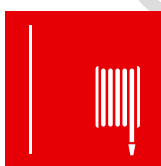
secu 704 R.I.A