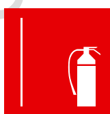
secu 705 extincteur