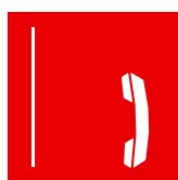
secu 703 téléphone incendie